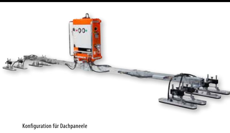
Konfiguration für Dachpaneele

VAKUUMMONTAGEGERÄT FÜR DACH- UND WANDPANEELE